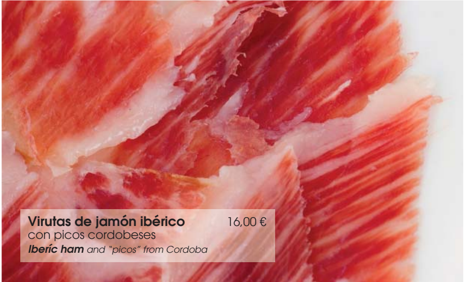
Virutas de jamón ibérico 16,00 € con picos cordobeses Iberic ham and "picos" from Cordoba

Queso de oveja puro Zamorano 9,00 € Cheese of Zamora