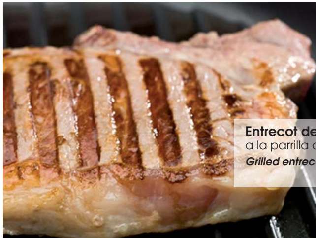
Entrecot de ternera a la parrilla con verduritas Grilled entrecote