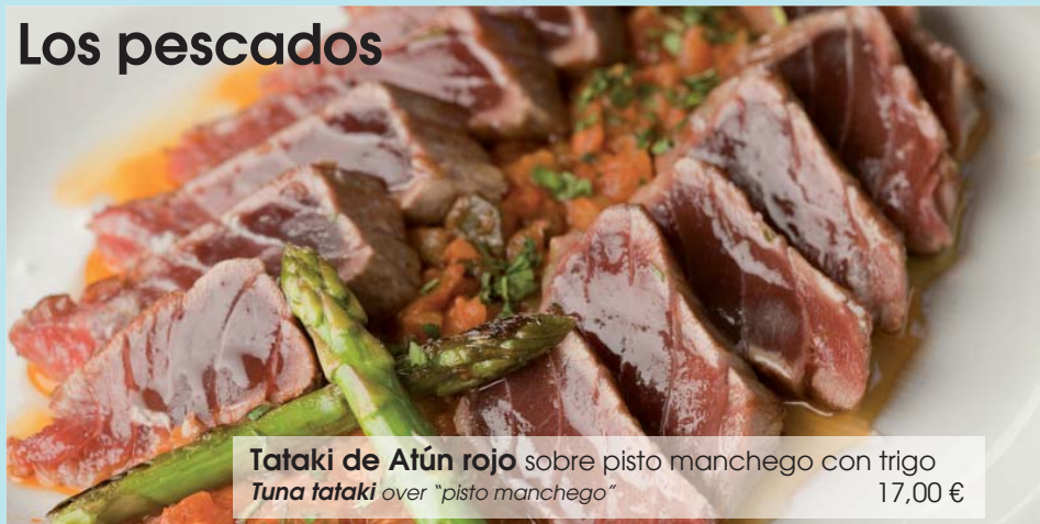
Tataki de Atún rojo sobre pisto manchego con trigo Tuna tataki over "pisto manchego"